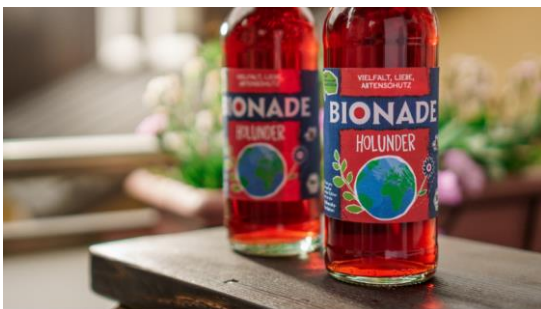
BIONADE Edition in limitierter Auflage