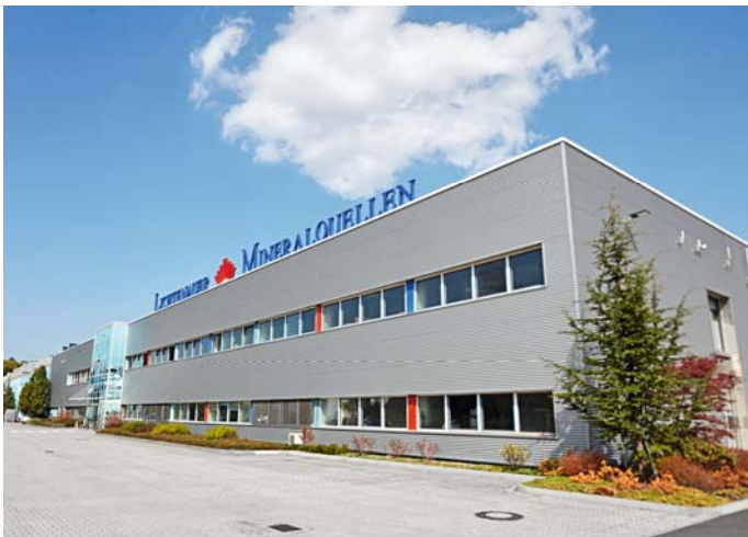
Bildunterschrift: Die Lichtenauer Mineralquellen präsentieren ihren ersten Nachhaltigkeitsbericht.