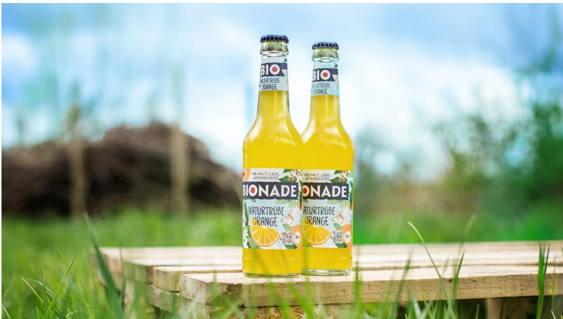
BIONADE Naturtrübe Orange als Sonderedition